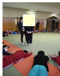
崎市立第三中学校との交流活動 平成26年12月11日・平成27年1月22日