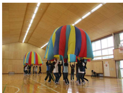
大室小学校との交流活動 平成27年2月18日