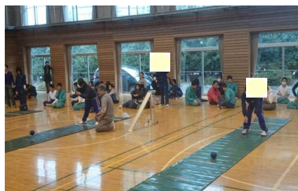
藤岡北高等学校園芸福祉コースとの交流活動 平成26年9月30日・平成26年11月20日