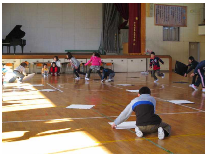
三郷小学校との交流活動 平成27年1月29日

交流教育は、しろうがね特別支援学校児童生徒の経験を広め、社会参加の態度を育成するとともに、小・中・高等学校等の児童生徒や地域の人々に、本校の児童生徒に対する理解と認識を深めていただくものです。昨年度の主な交流活動の様子と今年度のおおまかな年間の予定をご紹介します。