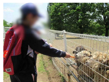
【六本木釣り堀（上）】 【大胡グリーンふらわー牧場（下）】