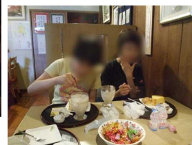
【おいしいケーキをいただきました】