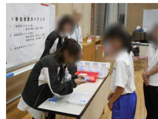
【中学部就業体験見学】【進路ガイダンスに参加】