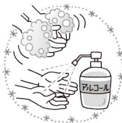
手洗いうがい アルコール消毒