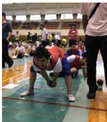
【スマイルボウリング】