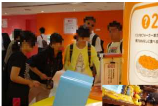
【NHKスタジオパークの常設展示（上）】