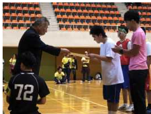
【バスケットボール表彰】