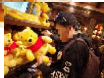
【東京ディズニーランドのショップ（右）】