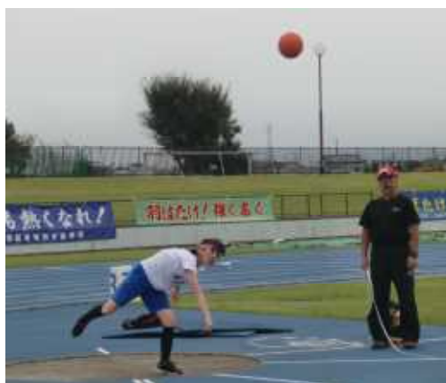
【ハンドボール投げ】