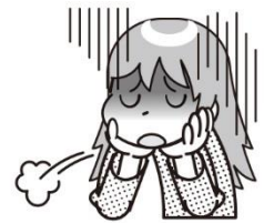
ゆううつな気分になる