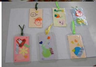
↑ しおりが 完成 →