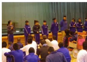
藤北生の自己紹介 ↑