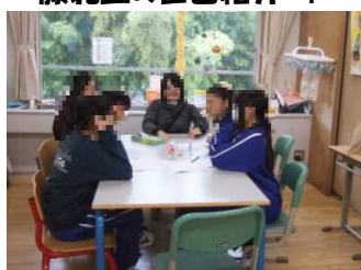
↑ 仲良く、しおり作り